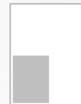
1/4 Page hauteur FU