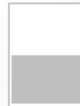
1/2 Page largeur FU