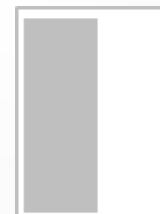
1/2 Page hauteur FU