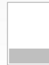
1/4 Page largeur FU